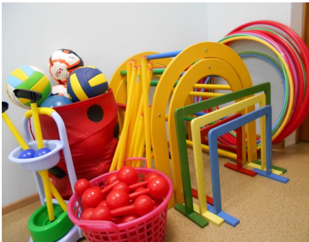
Технические средства оборудование: музыкальный центр. Физкультурно-оздоровительные уголки в группах.